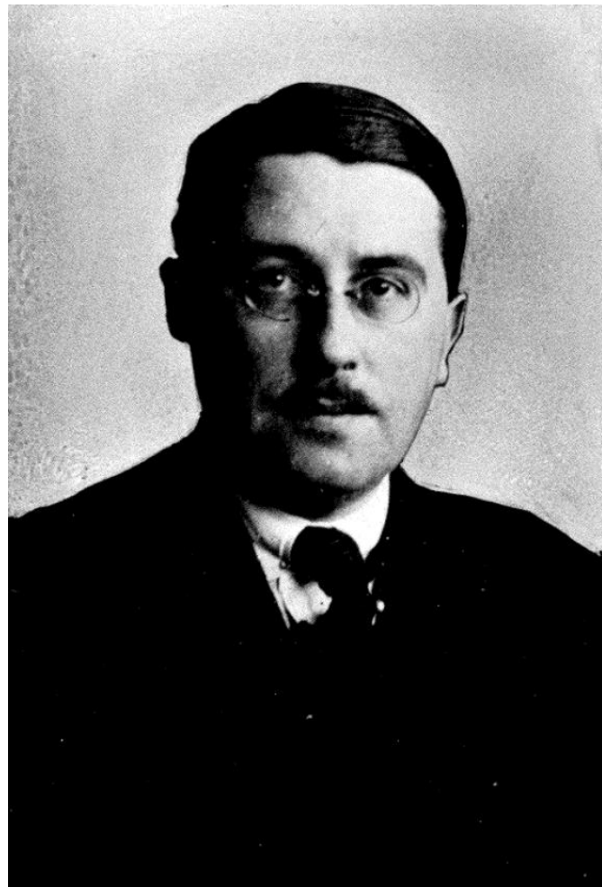
Gunnar Serner i mitten av 1920-talet.

Siste April 2026: Lundaspex. Mer om detta i kommande nummer.